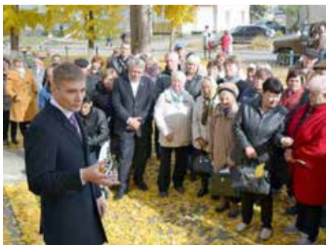
Валентин Коновалов на встрече с жителями края и на закладке нового корпуса больницы в Абакане

При единороссе Зимине предприниматели регистрировали предприятия в соседнем Красноярском крае из-за более привлекательной налоговой политики. Это негативно влияло на поступление налогов с бюджет Хакасии. С приходом губернатора Коновалова произошли изменения в налоговой сфере, улучшившие положение предпринимателей малого и среднего бизнеса, это стало пополнять региональную казну.