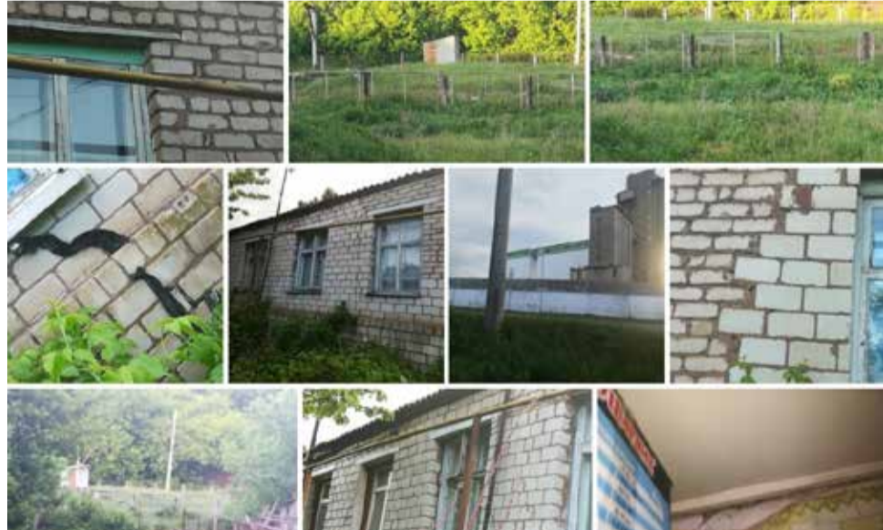
Скоро всё может рухнуть