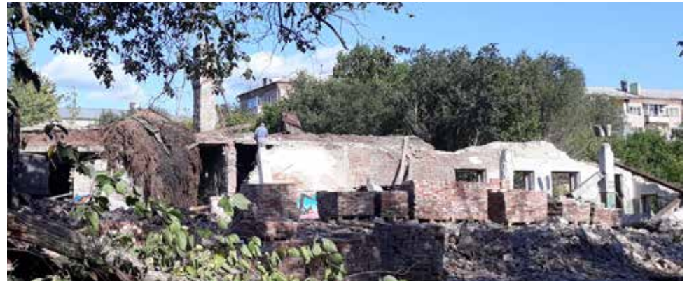
Рушат и рушат....

Получается, нет единого хозяина у ускользающей от нас исторической красоты. А всё потому, что задача у власти: пополнять казну за счёт продажи земель, сдачи их в аренду, а там «хоть трава не расти».