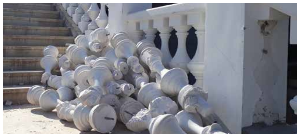
Многострадальный спуск к Уралу

Теперь мы просто с болью взираем на происходящее. И даже при, вдруг, удачном завершении работ, думаю, особой радости оренбуржцы не испытают. Слишком долго ждали, слишком много очевидного обмана и глупости пережили. Противно.