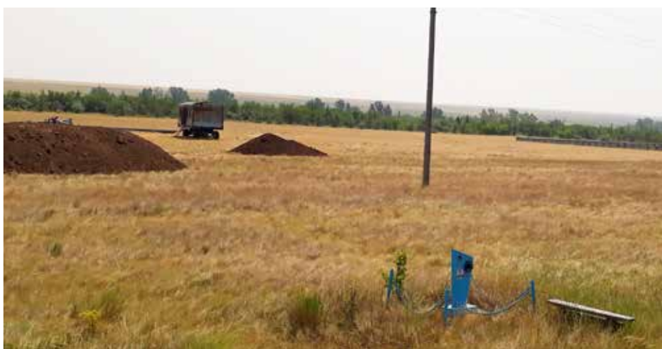
Почему именно здесь?

— Там наши предки покоятся, — сокрушаются жители села. — А рядом, выходит, будут находиться коровники со