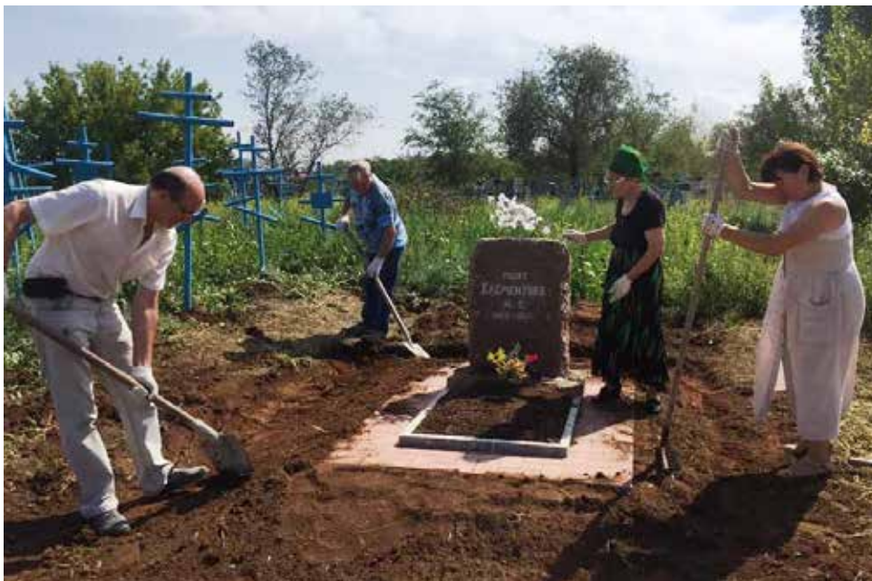
"Не зарастёт народная тропа..."

Когда на нашу страну напала фашистская Германия, он отслуживший в юные годы в Красной армии сразу же направился в военкомат с просьбой отправить его на фронт, но военно-врачебная ко-