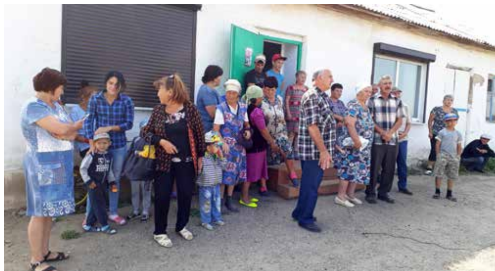
Сход селян в Андреевке