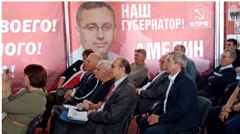
Идёт работа Пленума...