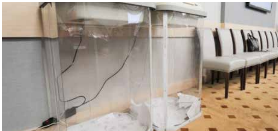
Почти пустые урны для голосования